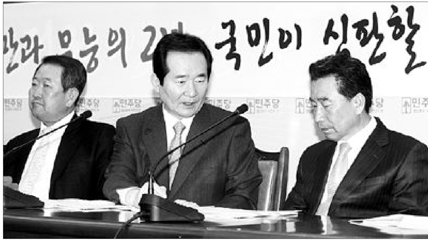
민주당이 여수, 순천, 광양 등의 기초단체장 후보 공천에도 시민배심원제 도입을 검토하고 있다. 사진은 지난 8일 오전 국회에서 열린 민주당 최고위원회의.