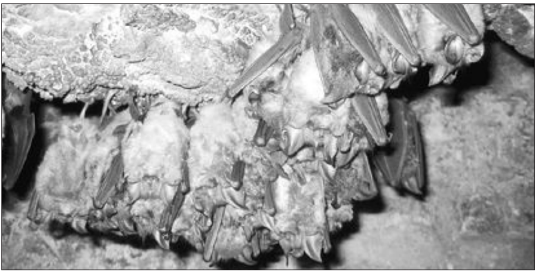
관박쥐가 대량 서식하고 있는 것으로 확인됐다.