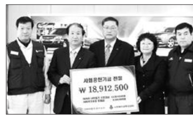
전 임직원은 ‘나눔이 곧 생활’이라는 마음으로 생활하고 있다”며 “앞으로 기다리는 나눔이 아니라 찾아가는 나눔 활동을 펼치겠다”고 말했다.