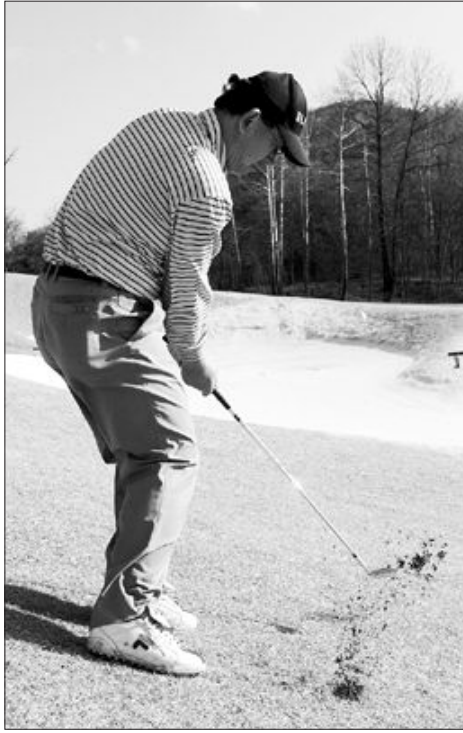
●볼이 발끝아래 있을때=볼의 위치가 발끝 머리 보다 낮은 곳에 있을 때는 평지에서 보다 볼이 더 가까이 서고 체중을 약간 왼쪽으로 싣는게 좋다.