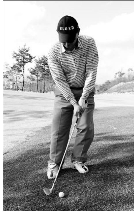
●왼발이 오르막에 있을때=업힐에서는 어깨의 선을 경사에 평행이 되도록 맞추어야 한다. 체중은 오른발에 실리게 하고 볼의 위치는 왼발의 끝에 둔다.