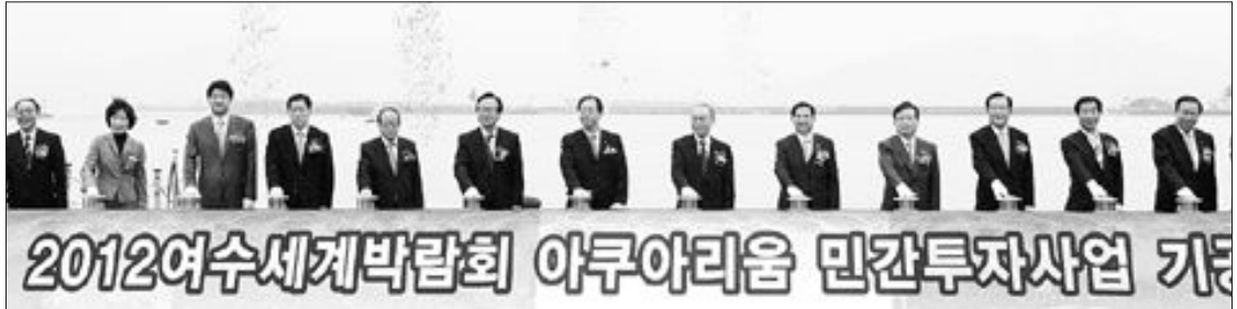
2012 여수세계박람회 아쿠아리움 기공식이 23일 여수신항 제 2부두에서 강동석 조직위원장, 박준영 전남도지사, 오현섭 여수시장, 김광현 여수시 박람회 준비위원장 등이 참석한 가운데 열렸다.