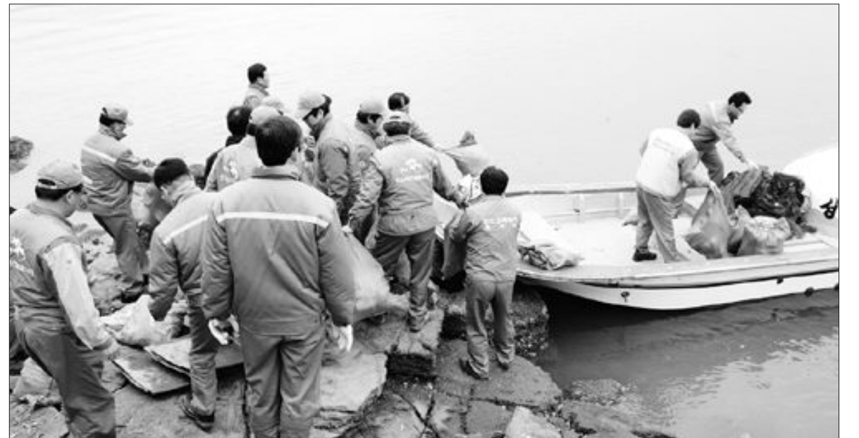
광양제철소(소장 김준식)는 지난 22일 제 18회 물의 날을 맞아 태인동 배밭도 해수욕장에서 지역민간단체와 합동 해양정화 활동을 벌였다.