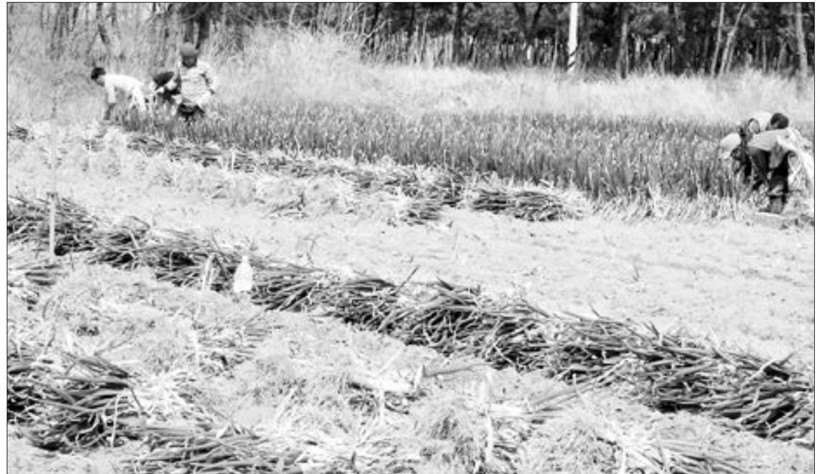
신안 대파 수확 신안군 임자면 대거리 들녘에서 주민들이 23일 대파를 수확하고 있다. 주민들은 밭떼기로 3.3㎡(1평)당 1만~1만5천원에 서울 가락동 농산물시장에 출하하고 있다.