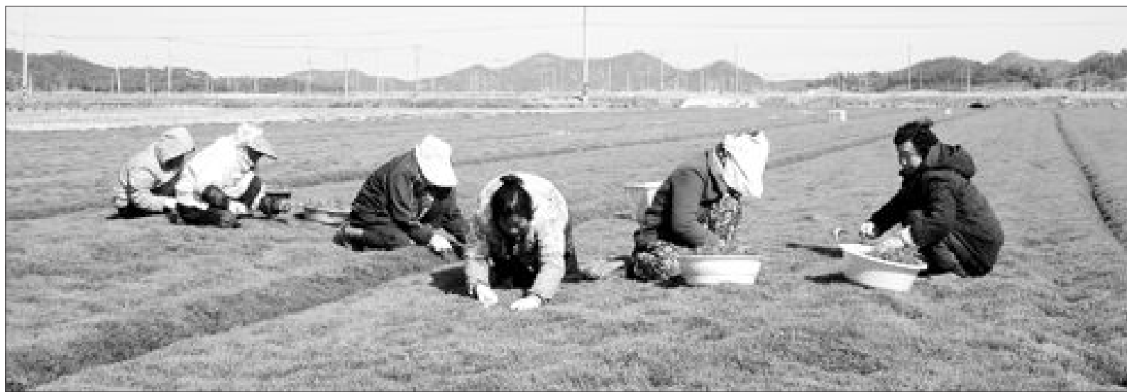
"웰빙식품 신안 세발나물 아시나요" 신안군 비금면 수대리 주민들이 28일 논지에서 '세발나물'(갯개미자리)을 수확하고 있다. 세발나물은 바닷가나 염전 주변, 간척지 등 농 소금기가 있는 땅에서 자생하는 갯나물로 4kg 한 상자당 2만원 선에 서울·광주지역 식당으로 판매되고 있다.