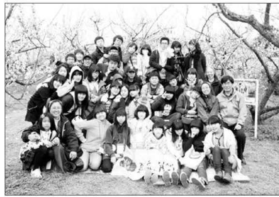
‘보해 젊은 일세 봉사단’ 회원들은 최근 해남군 산이면 보해매실농원에서 광주 나자렛집 원생들과 함께 매화를 그리는 등 봉사활동을 했다.