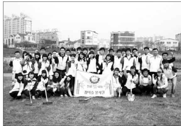
‘진로 참이슬 참이슬 봉사단’은 최근 광주천 둔치에서 쓰레기 줍기 등 하천 정화활동을 펼쳤다.