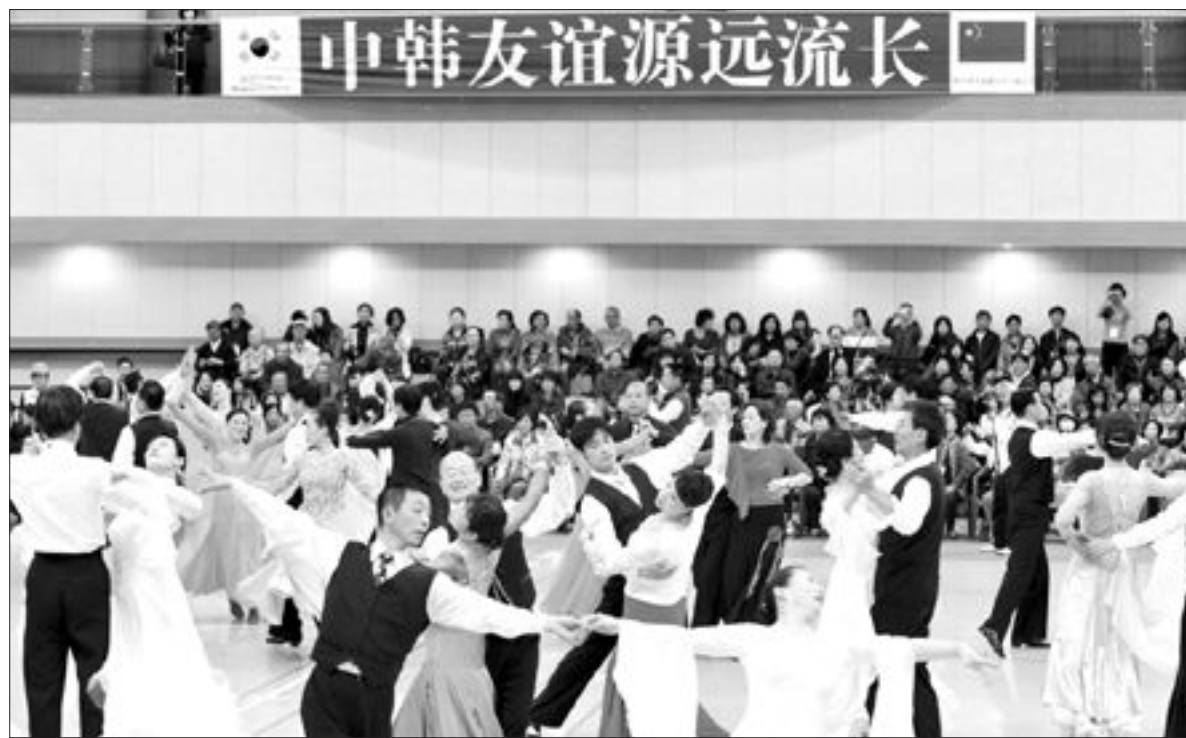
중국 노인 관광객 780명이 13일 광주 남구 노대동 빛고을노인건강타운을 찾아 광주시 노인들이 선보인 사교댄스를 흥미롭게 지켜보고 있다.

함께 어울리기도 했다. 중국 노인들은 12일 입국해 경기도를 거쳐 광주를 찾았으며, 하루를 머문 뒤 충청남도를 거쳐 15일 중국으로 떠날 예정이다.