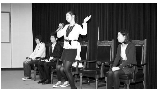
동신대(총장 정기언)는 최근 학내 국제회의장에서 제13기 홍보도우미 선발대회를 열어 1차 서류 전형을 통과한 36명 가운데 자기소개와 자기자랑을 통해 끼와 열정을 선보인 12명을 선발했다.