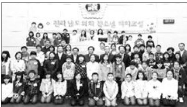
전남도의회가 지난 1일부터 15일간 개최한 '청소년 의회교실'이 성황리에 마무리됐다. 이번 청소년의회는 여수 등 19개 시·군 지역 40개 초등학교 학생 560명과 지도교사 600여명이 참여, 조례안 제정 및 전자 투표 등의 다양한 의정체험 활동을 펼쳤다.