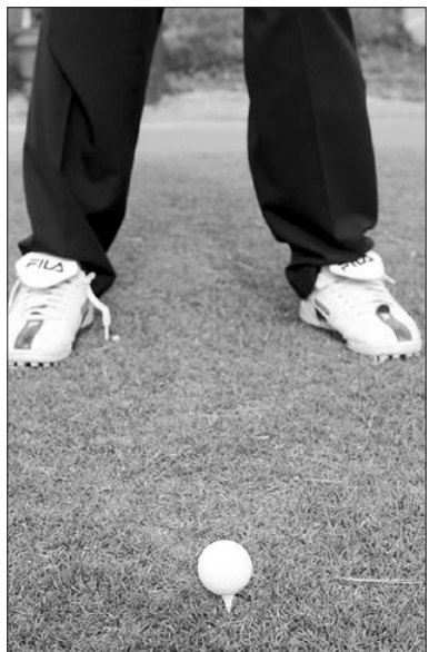
비거리를 늘리려면 높은 공 치는 연습을 하는게 좋는데, 볼을 티에 올려놓고 샷하는 것도 한 방법이다.