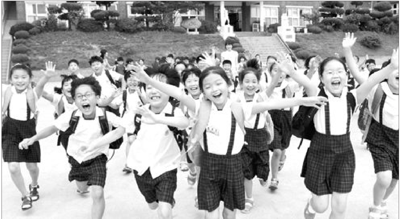
광주의 미래를 짊어질 광주지역 초등학생들이 해맑은 모습으로 교문을 나서고 있다. 광주교육은 수능 6년 연속 전국 1위라는 성과도 있었지만 갈수록 치열해지는 경쟁속에 교육의 질을 확보해야하는 등의 과제도 남아 있다.