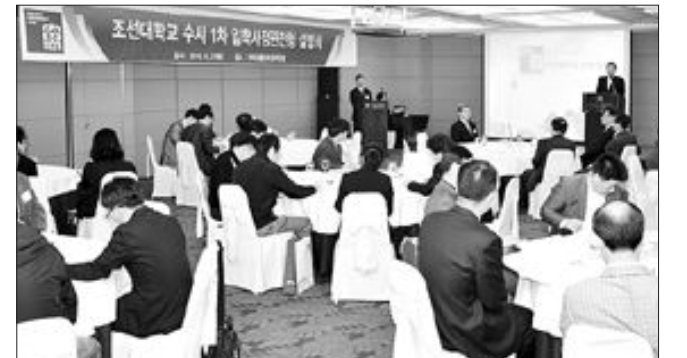
조선대학교 입학처(처장 한길영)는 27일 광주 라마다프라자 호텔에서 광주·전남·전북 지역 고교 3학년 진학부장들을 대상으로 2011학년도 수시모집(입학사정관 전형) 입학설명회를 가졌다.