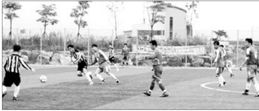
지난해 열린 제5회 전남도지사기 생활체육축구대회 모습. <광주일보 자료사진>

제6회 전남도지사기 생활체육축구대회가 14일부터 16일까지 3일간 화순 공설 운동장에서 열린다.