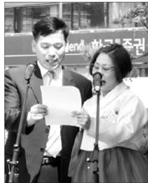
박씨는 광주YWCA의 요청에 3일간 고민 끝에 20가지의 선언문을 내었다. 25년간의 결혼생활을 하며 얻은 지혜를 다른 부부들에게 알려주

의뢰가 들어오자 망설이지 않고 승낙했다”며 “행복의 기준이 무엇인지는 잘 모르지만 서로 열심히 살아가고 있기 때문에 더 ভাল자는 마음에 선언을 하게 됐다”고 말했다. 이들 부부는 남편은 목사로서, 아내 또한 신앙심을 가지고 종교 생활을 하며 봉사활동 등 사회 공헌 활동도 많이 하고 있어 광주YWCA 회원들 사이에서도 신앙이 높다. 하지만 부부관계는 신망과는 다른 차원의 문제인 법. 이들 부부도 이혼 위기도 겪었고 싸우기도 하는 등 여타의 부부들처럼 문제가 있었다. “20대에 각자의 주장이 너무 강해 자주 다투었고, 30대 되니까 자녀문제 관련해서 자기방식의 교육관을 주장하다 보니 싸웠어요. 40대에는 경제적인 문제로 주로 다투게 되더군요. 싸우지 않을 순 없는데 어떻게 풀고 서로 존경하느냐에 따라 결론이 달라지는 것 같아요.”