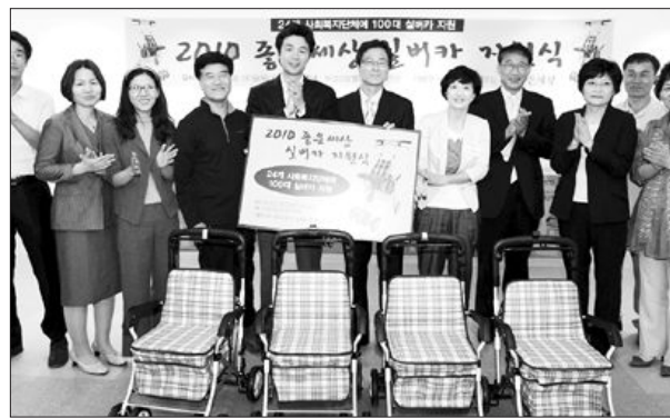
주로 이용하는 기관 또는 단체에 비치되거나, 개인에게 직접 지원된다.