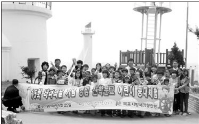
목포 지방해양항만청(청장 김삼열)은 최근 영암군 시중초등학교와 신학초교 학생들을 초청해 해남군 화원면에 위치한 목포구등대에서 등대 체험행사를 실시했다.