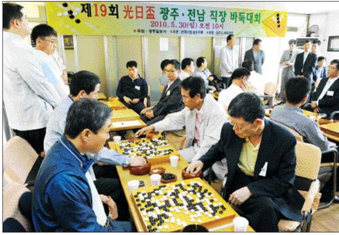
30일 한국기원 광주지부에서 열린 제19회 광일배 광주전남 직장 바둑대회에 참가한 기사들이 접전을 벌이고 있다.