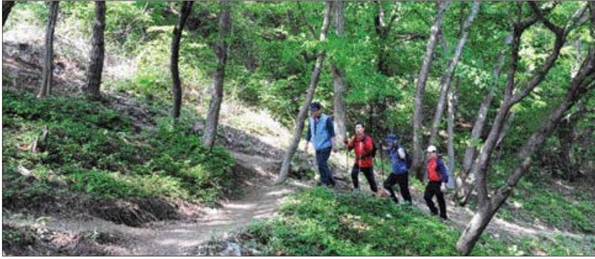
최근 정비된 13.5km의 무등산 옛길 3구간을 탐방객들이 걷고 있다. 최근 3구간 정비로 무등산 옛길 1~3구간 25.37km 조성이 마무리됐다.