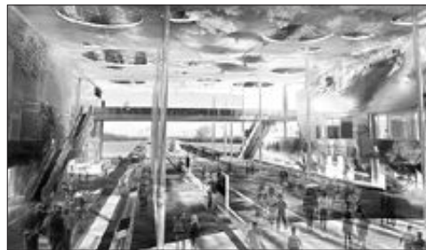
〈‘엑스포 디지털 갤러리’ 조감도〉

여수시 관계자는 “세계박람회를 계기로 남해안 거점도시로, 대한민국은 세계 5대 해양강국으로 도약하는 발판을 마련할 수 있도록 사업추진에 전력을 기울여겠다”고 말했다. /동부취재본부=박성태기자 sun@