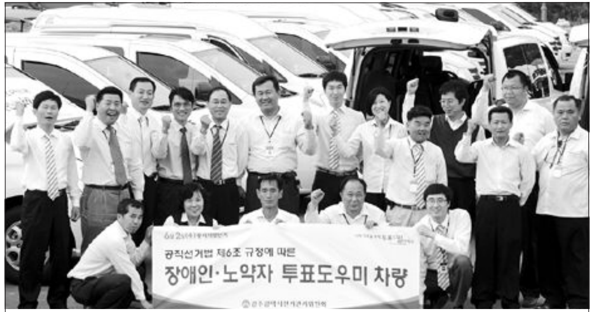
1일 광주시 광산구 수안동 광주시교통약자이동지원센터 주차장에서 장애인들의 투표소 이송을 도울 자원봉사자들이 안전운행을 다짐하고 있다.

감사원에서도 광주시 모 구청이 벌이고 있는 골프장 조성사업과 관련, 감사를 벌이고 있는 것으로 파악되고 있으며 전남도는 이미 공사와 관련해 부당한 업무 처리를 한 3개 지역 관계자들을 적발해 징계 등을 요구한 상태다. 전남도는 또 선거 이후에도 22개 시·군에 대한 감찰활동 강도를 한껏 높인다는 방침이다. 행정안전부 관계자는 “선거 기간 동안 특별감찰반을 꾸려 공무원 선거 개입 사례를 적발하는 등 공직기강 점검을 벌여왔다”면서 “선거 뒤에도 감찰활동을 강화할 것”이라고 말했다. /윤현석·김지움기자 chadol@kwangju.co.kr