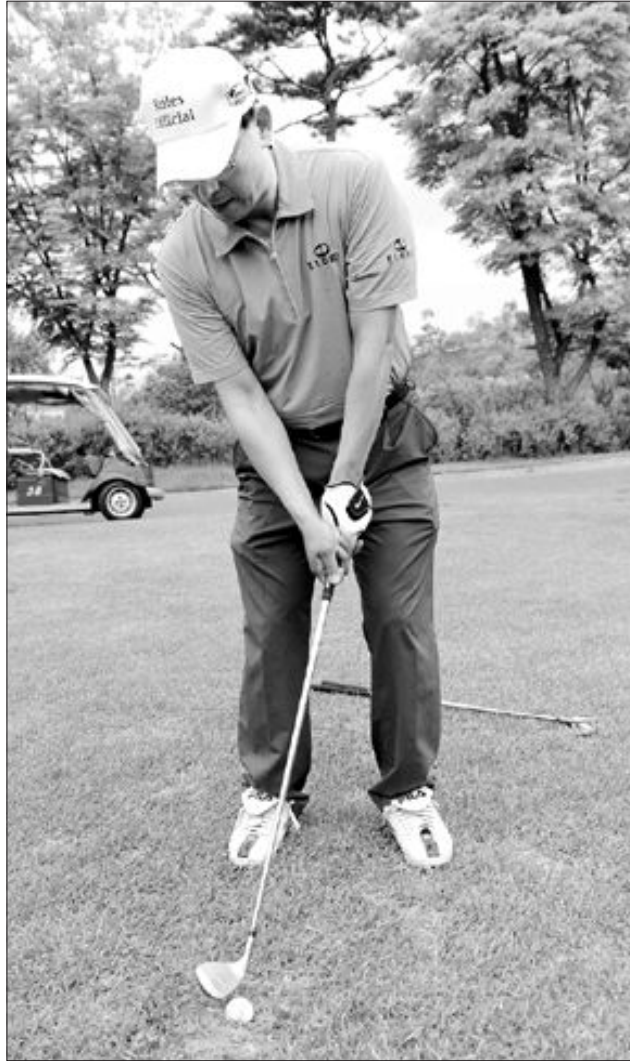
디봇 자국에서는 볼의 뒤를 강하게 내려치되 땅을 더 깊게 판다는 생각으로 스윙한다.