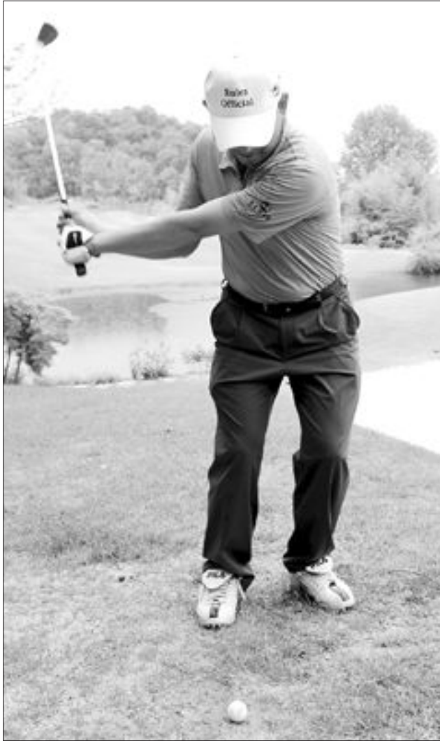
맨 땅에서 샷을 할 때는 볼의 밑부분을 쳐 백스핀이 걸림으로써 볼이 멀리 나가지 않도록 한다.