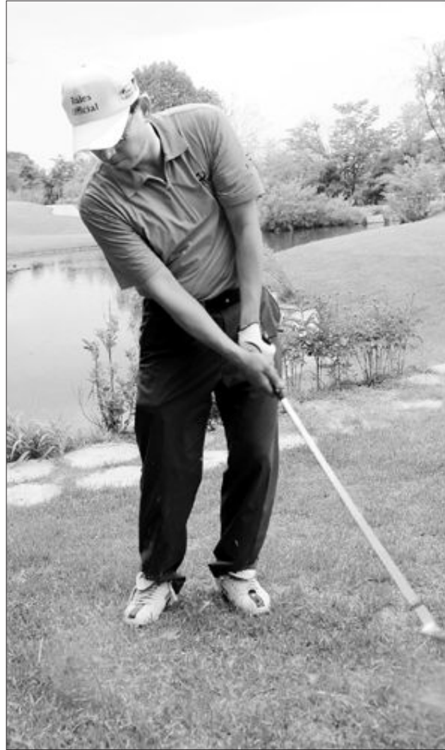
백스윙이 나무에 걸려 정상적인 스윙이 어려울 땐 그림을 짧게 잡고 샷하는게 좋다.