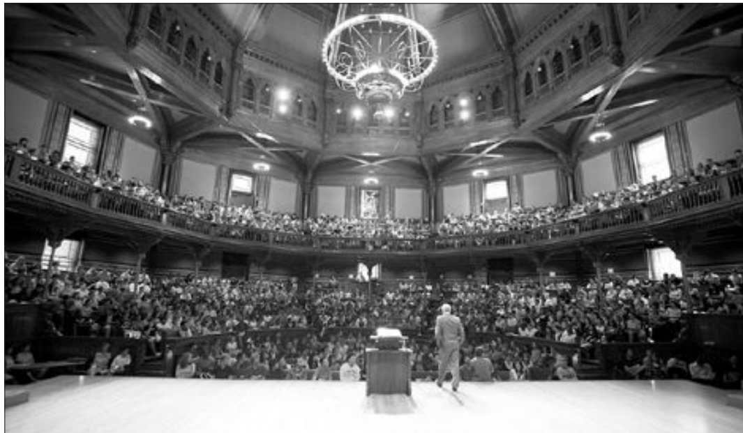
마이클 샌델은 정의의 본질을 파악하려면 어떤 행동이 사회적으로 옳은 것인지 여러 사람과 끊임없이 토론하고, 판에 박힌 생각에서 벗어나라고 강조한다. 샌델 교수의 하버드대 강의 모습.

민주 사회에서의 삶은 옳고 그름, 정의와 부정에 관한 이견으로 가득하게 마련이다. 어떤 사람은 부자에게 세금을 거두어 가난한 사람을 도와야 공정하다고 생각하지만 다른 사람은 노력으로 번 돈을 세 금으로 빼앗는 행위는 공정치 못하다고 생각한다. 대학의 소수집단우대정책을 놓고도 어떤 사람은 잘못을 바로잡는 정책이라고 하는 반면, 어떤 사람은 능력 있는 인재를 억압하는 정책이라고 비난한다. 어떤 사람은 테러 용의자들을 고문하는 행위는 자유사회에 걸맞지 않은 혐오스러운 일이라며 반대하나, 다른 사람은 테러를 예방하는 마지막 수단이라며 찬성한다. 선거에서는 이러한 의견에 따라 당락이 좌우되기도 한다. 존 롤스 이후 정의를 논하는 세계적 학자이자, 공동체이론의 4대 이론가로 꼽히는 마이클 샌델 하버드대 정치철학과 교수의 '정의란 무엇인가'는 자유 민주주의 사회에서 피할 수 없는 개인의 자유와 공동성, 평등과 불평등, 정의와 부정 등의 문제를 어떻게 이성적으로 다뤄야할지 흥미롭게 분석했다. 실제로 샌델 교수의 '정의(Justice) 강의'는 해마다 1000여명의 학생들이 몰려드는 하버드대 최고 인기강의이며, 이 책은 20년에 걸친 강의를 토대로 집필됐다. 일단 샌델 교수는 정의를 이해하기 위해 세 가지 도구를 제시한다. 공리주의와 자유주의, 그리고 미덕이다. 그는 독자들이 이 방식들을 통해 스스로 정의에 관한 견해를 돌아보게 하면서 과연 옳은 것이