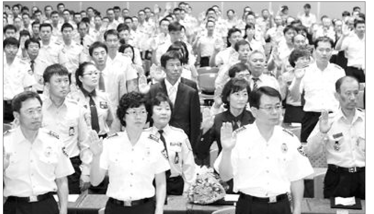
“교통사고를 줄입니다” 도로교통공단 광주·전남지부는 24일 광주 김대중컨벤션센터에서 사망사고를 절반으로 줄이기 위한 ‘2010 교통사고 줄이기 운동 범국민 대회’를 개최했다.

전남도는 이날 합의에 따라 보호구역이 해제되면 조선업체인 G중공업의 경우 2400억원의 해외수주사업을 원활하게 진행할 수 있는 건축물을 신축할 수 있게 되고, 다른 업체들 역시 공장 신축이 가능해져 고용 증대를 통해 지역경제 발전에도 크게 기여할 것이라고 밝혔다. 권익위 이재오 위원장은 "앞으로 남은 군사보호구역 완화를 위한 심의 절차가 잘 해결돼 중소기업의 애로사항이 깨끗이 해소되길 바란다"고 말했다.