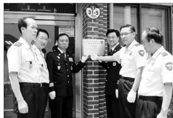
위를 차지해 베스트 지구대로 선정, 2분기 연속 베스트 지구대로 선정되는 영광을 차지했다.