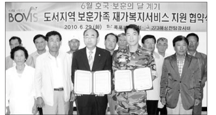
양문택(왼쪽에서 세번째) 목포보훈지청장은 29일 흑산도에서 목포 3함대 소속 273전담함시대와 '보훈가족 재가복지서비스 지원 협약'을 맺고 흑산도 거주 보훈가족에게 집수리 등 다양한 복지 서비스를 제공하기로 했다.