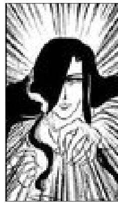
굿바이 미스터 블랙

“만화는 법으로도 일반인의 인식으로도 마땅히 보호받아야 할 소수창작물입니다. 독자들이 어떻게 받아들이냐에 따라 만화의 가치가 달라지는 만큼 색안경을 끼지 않고 응원해줬으면 좋겠습니다.”