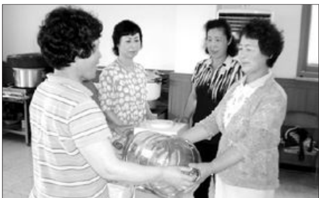
강진군 마량면 생활개선회와 여성의용소방대 등 4개 여성단체는 떡국판매 수익금 100만원으로 최근 6개마을 노인회에 정수기를 각각 1대씩 기증했다.