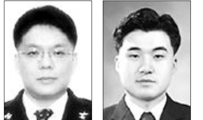
최성현 씨 조성원 씨

박천영(57·에너지자원공학과) 조선대 교수가 6일 대구 호텔 인터볼고 엑스코에서 개최되는 ‘2010 대한민국의학기술연차대회’에서 제20회 과학기술우수논문상을 수상한다. 한국과학기술단체총연합회가 2009년도에 가장 우수한 논문을 선정해 시상하는 이번 논문상에서 박 교수는 ‘광양 폐광광산에서 생성되는 산성광산배수와 황갈색철수산화물의 지하학적 성분에 대한 계절적 변화 특성’ 논문으로 수상했다. /채희중기자 chae@kwangju.co.kr