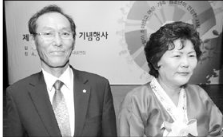
집안 일과 들일을 함께하는 통에 너무 힘들어 남편이 원망스러울 때가 한 두 번이 아니었다. 하지만 30년 넘게 살면서 이들 부부는 많이 변했다.

최씨 부부가 지난 1977년 결혼할 때부터 이처럼 살갑게 살았던 것은 아니다. 결혼 초기만 해도 최씨는 특하면 “남자가~, 여자가~”라며 남성 우월주의적인 발언을 예사로 했다.