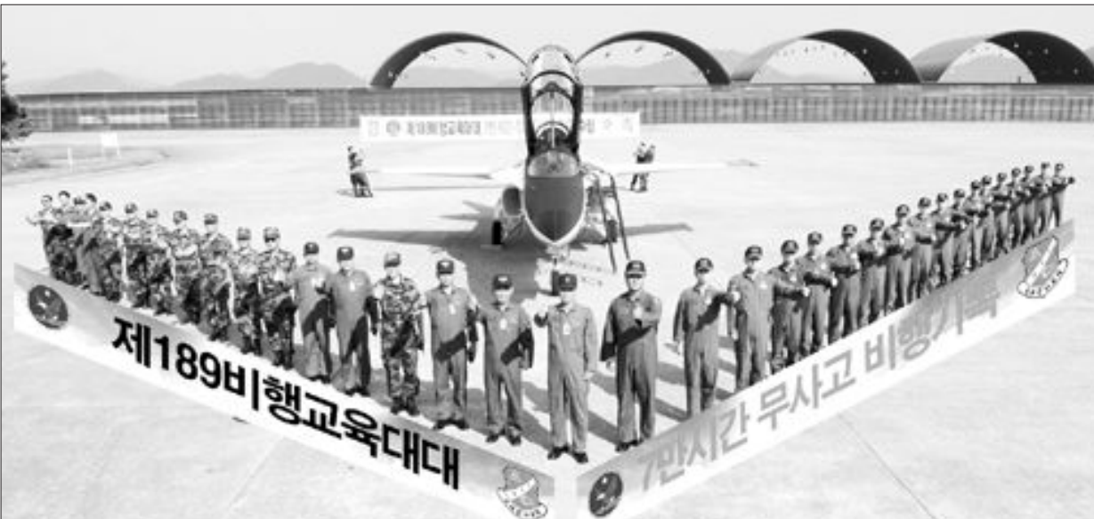
8일 제1전비 지휘관과 참모, 조종사들이 189전투비행대대의 '7만시간 무사고 비행' 기록 달성을 기념하는 퍼포먼스를 하고 있다.