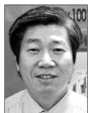
원봉사를 하시며 어려운 이웃을 배려하라고 말씀하셨다”라며 “매년 정기적으로 실시할 것”이라고