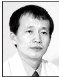
감염관리·시설환경관리·질향상과 환자안전·환자진료·의료정보·의무기록·응급·수술관리체계·검사 등 의료서비스