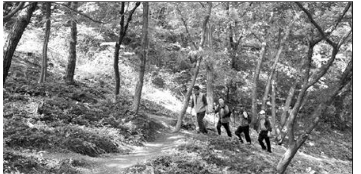
광주시 동구 산수동 장원삼거리~충장사~가사문화관을 잇는 무등산 옛길 3구간의 일부. 무등산 북부권을 조망할 수 있는 옛길 3구간은 오는 24일 일반에 개방된다.