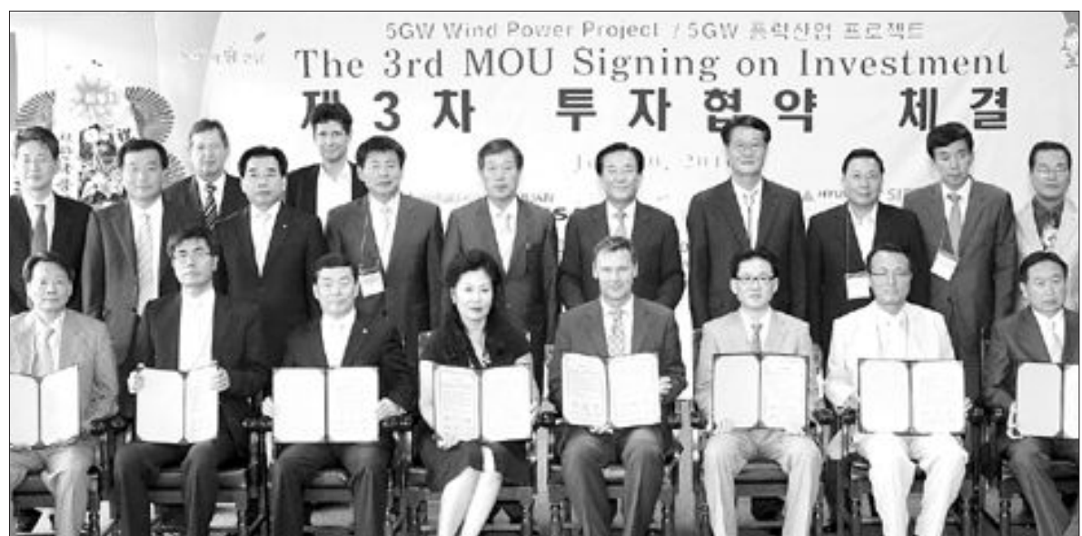
전남도와 해남, 무안, 영광, 진도, 신안군은 20일 오후 도청 서재필실에서 현대중공업과 덴마크의 지멘스, 독일 코윈드 등 13개 기업과 1조6000억원 규모의 5GW 풍력산업 프로젝트 제3차 투자협약을 체결했다.