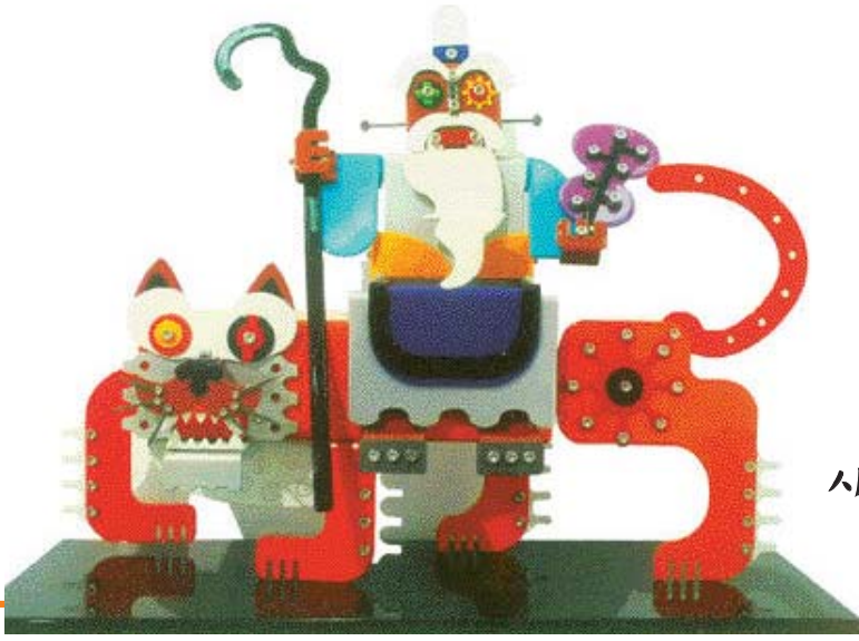
고근호 작 '산신호랑이'

회화·조각·사진 등 광주시 예술로 소용하는 미술그룹 '새벽' 의기투합 내달 22일까지 시립미술관 금남로 분관 초대전