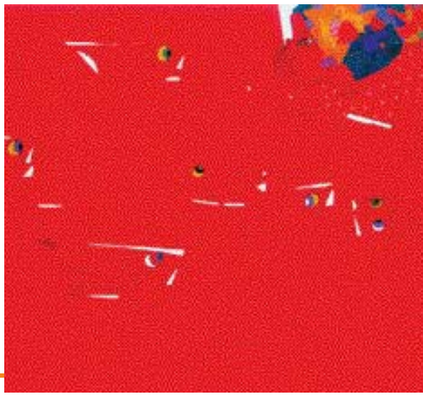
임종두 작 '동행'

회화·조각·사진 등 광주시 예술로 소용하는 미술그룹 '새벽' 의기투합 내달 22일까지 시립미술관 금남로 분관 초대전