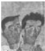
故 이청준 전집 표지