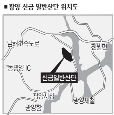
■ 광양 신금 일반산단 위치도

시민들은 “2007년 환경부가 국회에 제출한 자료에 비소·크롬·납·구리 등 중금속 유해물질이 다량 함유됐다”는 분석이 나왔고 토양 및 지하수 오염이 우려된다”며 석탄재반입 반대 입장을 분명히 했다. 광양 환경협의회는 “지난해 중마 동 와우택지개발 지구 조성시에도 석탄재 10만 톤을 매립토로 사용하는데 문제가 있었는데 또다시 하동 화력발전소에서 발생한 부산물을 광양시에