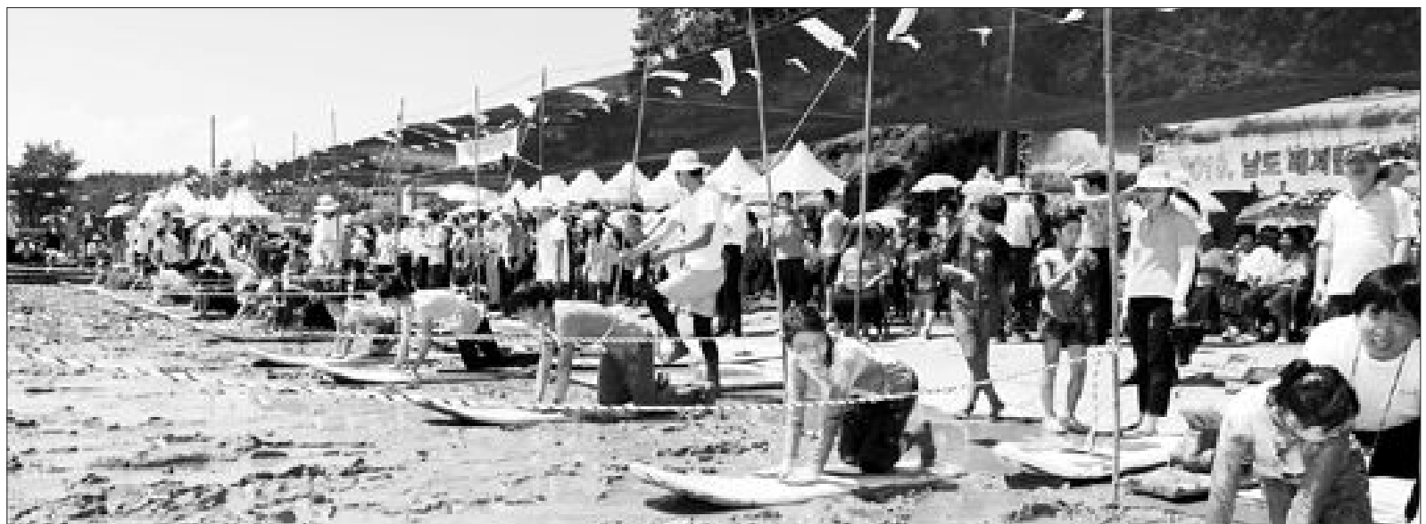
‘2010 남도레저 뱀배 레이싱 대회’가 지난 8일 보성군 벌교읍 장암리 갯벌에서 500여명이 참가한 가운데 열렸다. 전남도는 갯벌체험이 인기를 더해가자 교막을 캐기위한 이동수단으로 사용되는 전통 뱀배를 개조해 레저용 뱀배를 고안했다.

때문에 양질의 토양과 7대 3 비율로 섞어 매립할 경우 하자가 없어 이를 제외할만한 법적 근거가 없다”면서 “신금산단 주변마을 주민의 반대는 없으나 일부 시민들의 반대가 커 신중을 기하고 있다”고 말했다. 이러한 이 과정은 “폐기물 재활용신고가 들어오면 지역 정서를 감안해 신중한 판단을 위해 해당 실과와 협의 절차를 밟을 계획”이라고 밝혔다. 한편 광양시는 하동화력이 석탄회 반입 신고를 접수할 경우 민원조정위를 열어 신고서류 접수 유무를 결정할 계획이어서 석탄회 반입 승인여부에 귀추가 주목되고 있다.