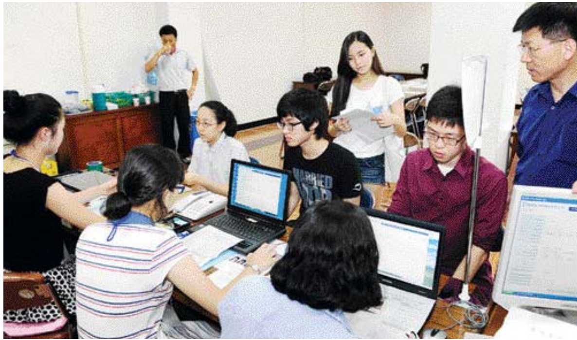
수능 원서접수 오는 11월 18일 치러지는 2011학년도 대학수학능력시험 원서접수가 시작된 25일 수험생들이 광주시 교육청에서 관련 서류를 제출하고 있다.