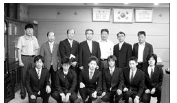
일본 히타치나카시의 국립이바라키공업전문학교 6명은 12일까지 조선이공대학에서 인턴십 연수를 한다.