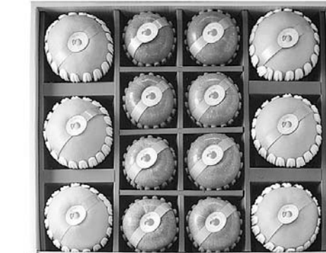
명품 사과·배 혼합세트