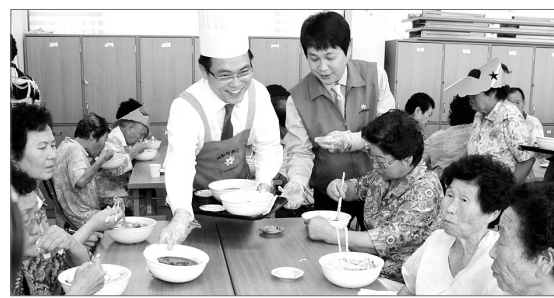
(주)광주신세계백화점은 한가위를 맞아 14일 오전 광주시 서구 양동주민센터에서 소외된 어르신들에게 음식을 대접하고 여흥을 함께 하는 등 봉사활동을 했다.