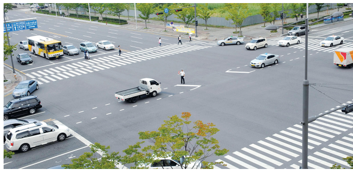
15일 오전 광주시 서구 치평동 BYC건물 앞 4거리. 좌회전 유도차로 시범운영이 시작됐지만 상당수 운전자들이 유도차로 차량을 진입시키지 않는 등 혼선이 빚어졌다.