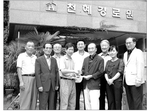
KT 광주전남 동우회원들은 지난 15일 추석을 맞이하여 정성껏 모금한 사랑의 성금을 천혜경로원을 방문, 전달하고 어르신들을 위로했다.