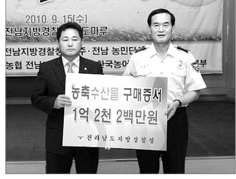
전남지방경찰청(청장 박용우)은 지난 15일 청사 내 남도마루에서 ‘우리 농축산물을 직거래 장터’를 열고 1억2200만원 상당의 농축산물을 구입했다.