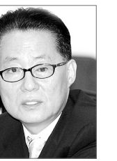
(서부취재본부 = 이상선기자 sslee@)

박지원 국회의원(민주당 비례대표)이 최근 '중금속 낙지' 파동과 관련, "낙지에 아무 문제가 없으니 많이 사드셔서 어려운 서민을 도와 달라"고 호소하고 나섰다.