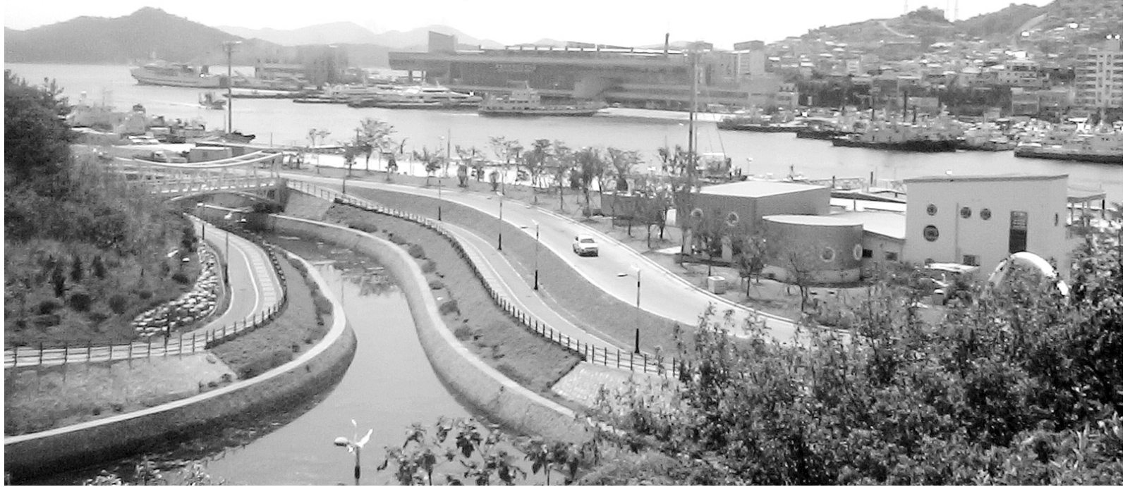
옛 모습 찾아가는 삼학도

또 전남개발공사는 2012년 상반기까지 해양수산복합센터 인근에 수산물 전문 음식단지인 'Sea-Food Town'을 조성할 예정이다.