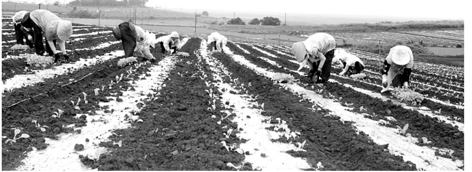
들녘에서 익어가는 아낙들의 가을

해남군 마산면 용소리 주민들이 무 조종숙기에 여념이 없다. 지난 9월초 피종한 무는 오는 11월중순부터 김장무로 전국에 출하하게 된다. /*서부취재본부=박희석기자 dia@