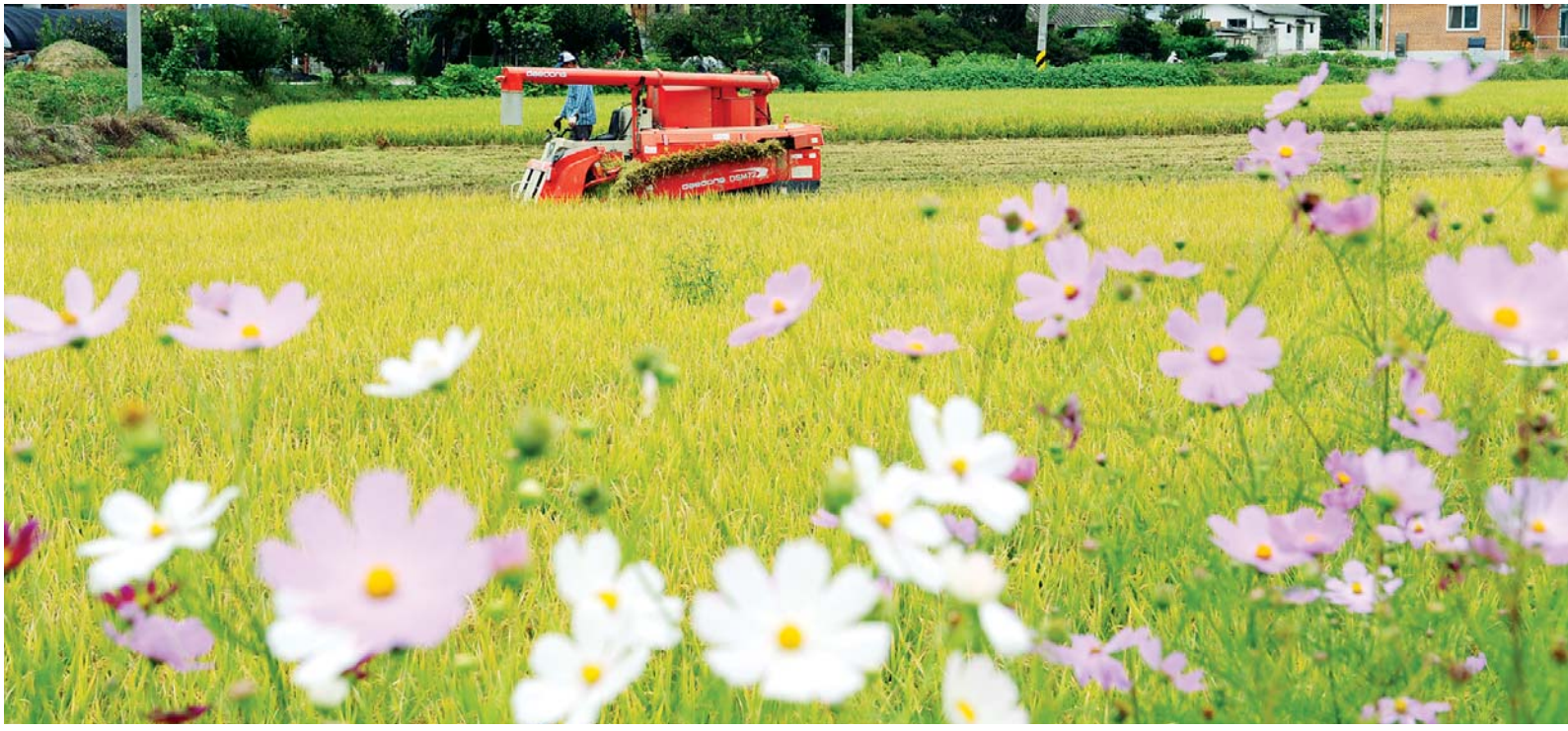
코스모스와 황금벼 29일 장성군 삼서면 들녘에서 만개한 코스모스가 가을의 정취를 더하는 가운데 한 농민이 누렇게 익은 벼를 수확하고 있다.