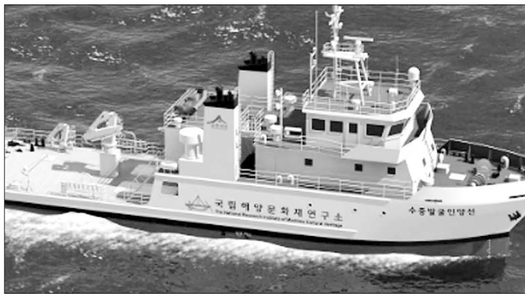
다. 촬영·잠수설비·잠수통제실, 갑압 챔버, 현장 감시카메라 등을 탑재한 발골조사 장비, 실시간 수중통신 및

문화재연구소는 지난 2006년 11월 취항한 19t 규모의 유물 조사선 ‘씨뮤즈’호가 있지만 규모가 작아 24시간 작업과 유물인양 및 적재를 할 수 없어 많은 불편을 겪었다. 이와함께 연구소는 오는 15일까지 수중문화재 발굴과 보존의 의미를 잘 담고, 연구소 이미지에 맞는 전용선 이름을 공모하고 있다. 연구소 홈페이지(www.seamuse.go.kr) 공모 게시판에 제안서와 함께 등록하면 된다.