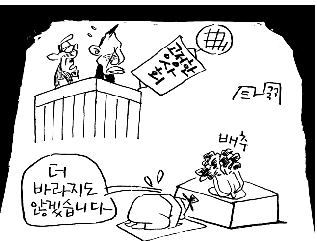
김치나 좀 공정하게 먹어 봅시다