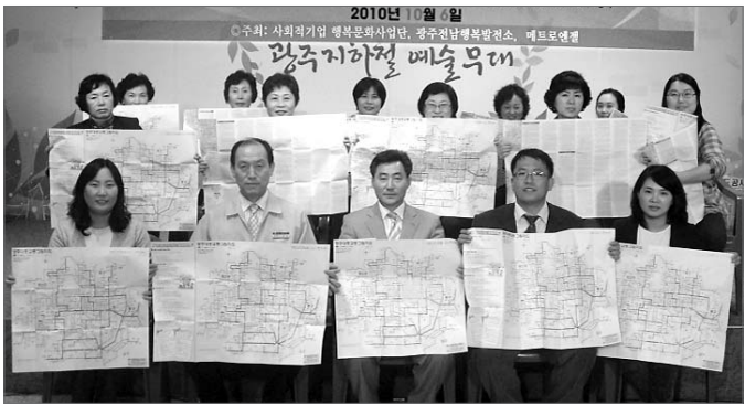
행복문화사업단과 메트로엔젤은 6일 녹색생활 실천수칙 20가지 표지와 건강기능식품지원센터 안내 등이 수록된 ‘탄소절감 대중교통노선 지도’를 2만5000부를 제작·배포했다.