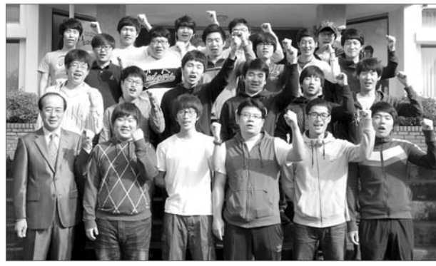
한국폴리텍 V대학 광주캠퍼스 동아리 ‘폴리스킬’ 회원들.