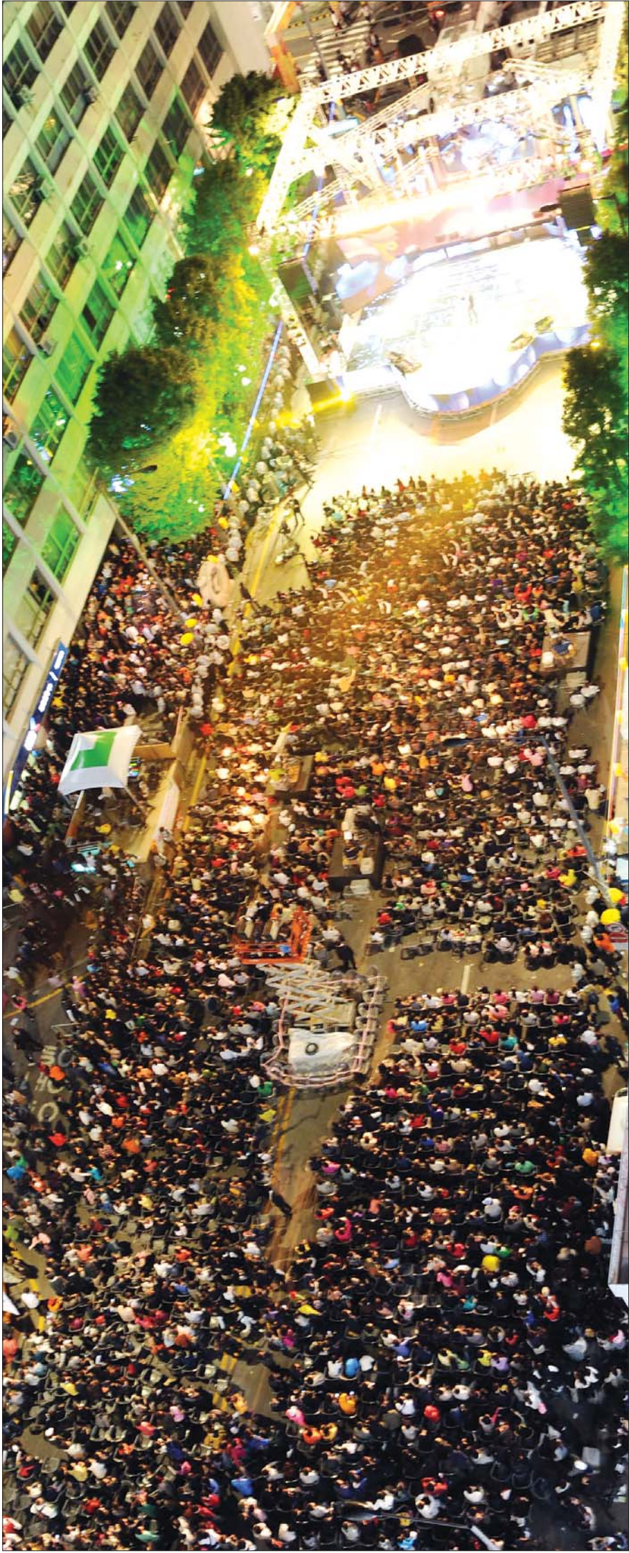
밀려든 추억 인파 '7080'의 아련한 옛 추억을 넘어 '1020'까지 모두가 하나로 어우러졌다. 충장축제 이틀째인 지난 6일 오후 금남로 전일 발당 앞 특설무대에서 열린 '아이러브 충장로' 공연을 보기 위해 몰려든 시민들이 인산인해를 이뤘다.