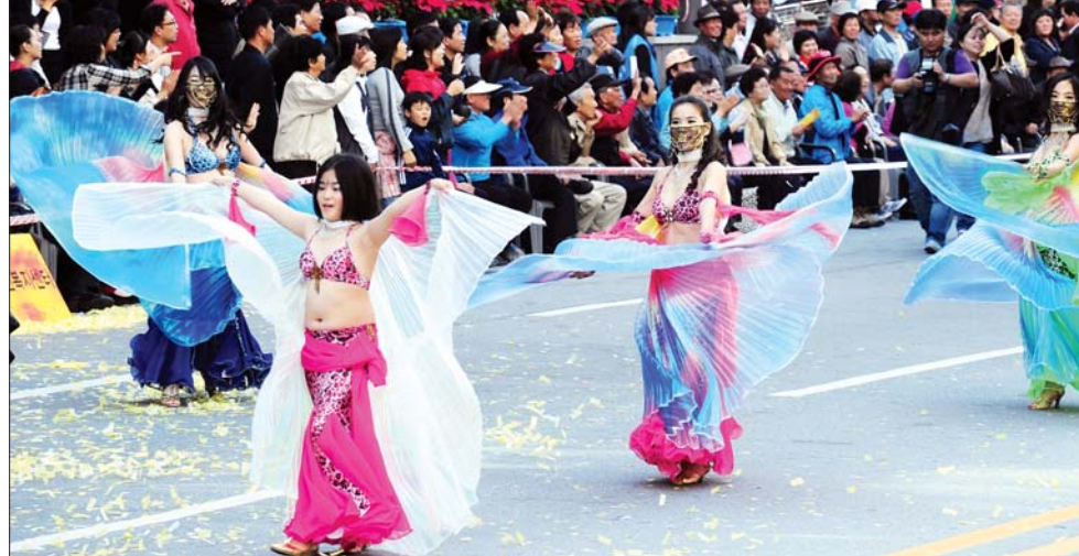
밸리 댄서의 유혹 금남로에서 펼쳐진 거리 퍼레이드에 참가한 밸리 댄서들이 색색의 화려한 날개짓을 하며 광주 도심을 수놓았다.