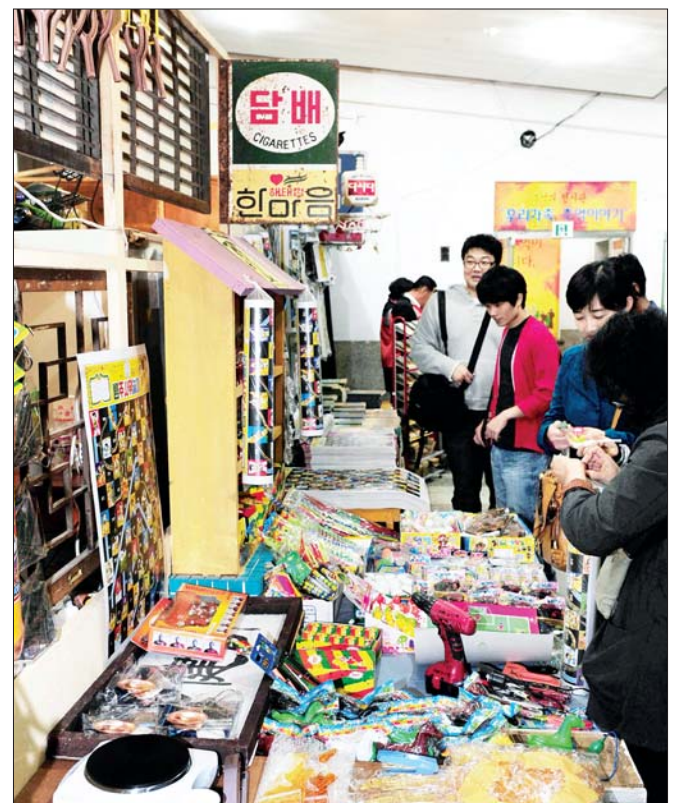
시간이 멈춘 곳 1980년대에서 시간이 멈춘 곳이 있다. 금남로 옛 중앙교회에 마련된 '추억의 가게'에서 시민들이 30~40년 전의 장난감·과자를 고르고 있다.

광주CBS 50년 1961-2011 창립 50년 "광주CBS 역사50년, 미래50년 비전선포 기념"