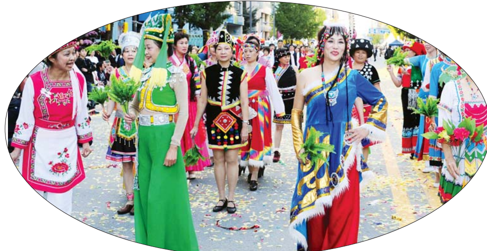
중국인도 참여 '추억의 카니발' 거리 퍼레이드에서 중국전통 복장을 입은 중국인 30여명이 패션쇼를 벌이며 금남로 일대를 행진하고 있다.