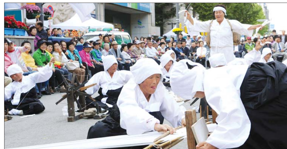
강진 하신베를놀이 시골 할아버지, 할머니들도 축제의 주인공이 됐다. 축제 사흘째인 7일, 금남로 3가 거리무대에서 강진군 군동면의 전통민속놀이인 '하신베를놀이'가 시연돼 시민들의 눈길을 끌었다.