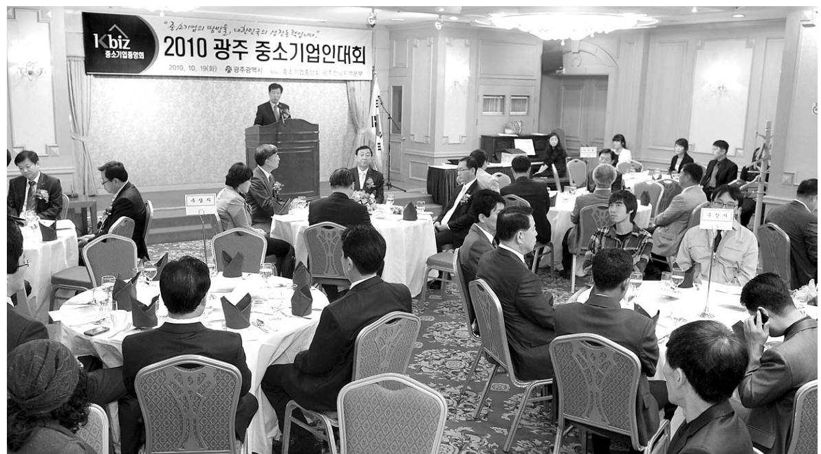
2010 광주중소기업인대회가 19일 오전 광주 서구 치평동 센트럴호텔 연회장에서 지역중소기업인 300여명이 참석한 가운데 열렸다.