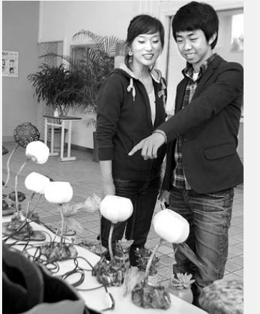
함평지역 한 노인요양시설 노인들이 갈고 닦은 솜씨로 만든 작품 전시회를 열어 화제다.