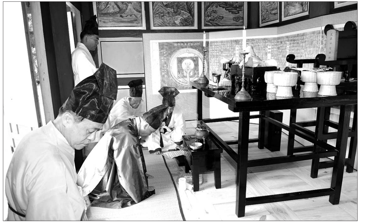
하서 김인후 선생 500주년 고유제 지내

이에 대해 나주시 관계자는 "도로 부지의 경우 지반다짐이 제대로 이뤄지지 않아 연약지반에 따른 문제점을 보강할 계획이다"며 "전반적으로 지반 침하우려는 크게 우려하지 않아도 될 것으로 판단하고 있다"고 밝혔다. /중부취재본부=최승렬기자 srchoi@