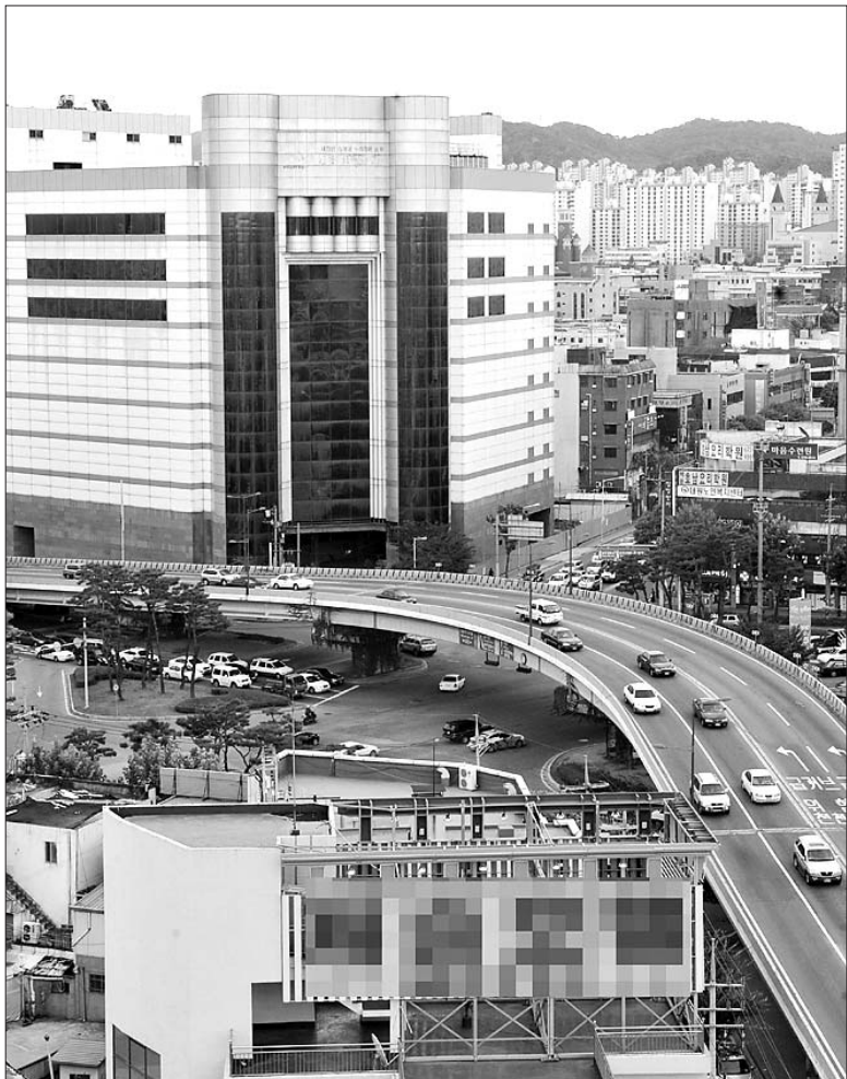
25일 광주 남구가 청사를 이전하겠다고 밝힌 주월동 옛 화니백화점 건물. 이 건물은 지난 1997년 화니백화점 부도 이후 13년이 넘게 방치되고 있다.

광주지역 전기자동차 개발·생산 업체인 '탑알엔디'와 합병을 결정한 '지앤디윈텍'이 본사를 충남 아산에서 광주로 이전할 방침이다. 이에 따라 'EV(electric vehicle·전기차) 클러스터' 조성을 비롯 국내 전기차 사업을 선도하고 있는 광주 지역 전기차 매카 구축 사업이 한층 탄력을 받게 됐다. 25일 광주시와 지앤디윈텍에 따르면 코스타 사장인 지앤디윈텍은 최근 전기차 사업에 집중하기 위해 본사를 충남 아산에서 광주시로 옮기기로 하고, 오는 12월1일 주주총회에 '본점 소재지 변경안'을 상정했다. 이날 주주총회에서는 탑알엔디와 합병 전 이 회사 임원을 이사로 선임하는 내용의 '이사 선임의 건'도 결의할 방침이다. 앞서 지앤디윈텍은 지난 14일 이사회를 열어 탑알엔디와 합병승인을 결의했다. 지앤디윈텍과 탑알엔디의 합병비율은 1대26.3935243이며, 합병날짜는 11월16일이다. 지앤디윈텍은 "탑알엔디와 합병으로 사업다각화를 통한 매출 증대와 안정적인 수익구조를 기반으로 한 경쟁력 강화 및 경영의 효율성 제고를 실현할 것"이라고 설명했다. 지앤디윈텍은 전자부품통신기기 제조업체로 아산과 광주공장(평동산단)에 380여명의 직원이 근무하고 있으며 지난해 매출액은 720억원에 이른다. 지앤디윈텍의 광주 이전은 에어컨·냉장고·세탁기 등의 핵심부품인 컨트롤러와 리모컨 생산·판매를 주력하던 사업영역을 전기차 사업으로 다각화하는 것으로 받아들여지고 있다. 이를 위해 지앤디윈텍은 지난 5월 광주시와 호남광역경제권 선도산업지원단 등과 '광주 EV 클러스터' 구축에 주도적으로 참여했다. 'EV 클러스터'는 전기차의 핵심부품 국산화와 완성차 생산, 내연기관 차량의 전기차 개조 등 다양한 기술개발과 시험생산, 실증 등을 목표로 하고 있다. 광주시는 지앤디윈텍의 광주 이전에 맞춰 취득세·등록세·재산세 면제 등 세제 혜택과 광역경제권 선도사업 참여, 정책자금 및 홍보·마케팅 지원 등 인센티브를 제공할 예정이다. 또 지앤디윈텍에서 개발한 전기차를 관광 차량으로 우선 구입할 계획이다. 【박정욱기자 jwpark@kwangju.co.kr】