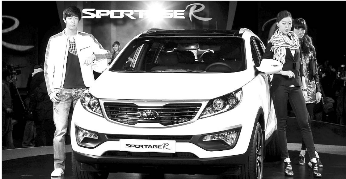
지난 3월23일 서울 워커히호텔에서 열린 기아차 광주2공장에서 생산되는 '스포티지R' 신차 발표회.

기아자동차 광주공장은 광주 경제의 30%를 차지하는 '광주 제조업 1번지'다. 올해 초 지역경제의 한 축을 담당하던 건설업이 붕괴하면서 기아차 광주공장의 지역경제 의존도는 더욱 높아졌다. 여기에 최근 연 50만대 생산체제 개편 사업에 성공리에 마무리하면서 글로벌 공장으로서 도약할 기반을 마련했다. 지역경제를 이끌고 있는 기아차 광주공장의 '명품 삼총사'를 통해 지역제품의 우수성과 뛰어난 기술력을 소개한다.