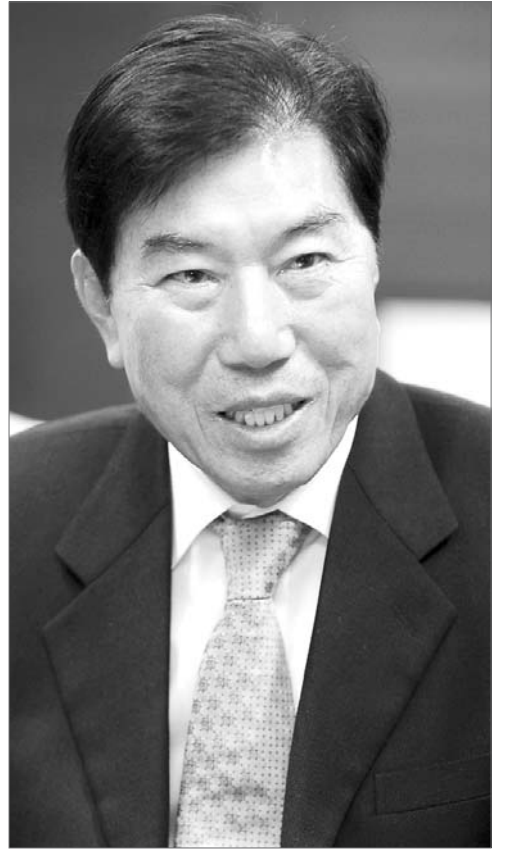
/오광륙기자 kroh@

회발전으로 연결하기 위해 광주미술관회 회원들이 힘을 모아 더욱 다양한 미술 강좌와 프로그램을 만들겠다는 포부를 밝혔다. "갓 대학을 졸업한 신진 작가들을 발굴해 전시를 열어주고 있는데, 이를 더욱 확대하고 다양한 영상 자료를 통해 청소년들이 현대 미술을 이해할 수 있는 강좌도 개설하겠습니다."